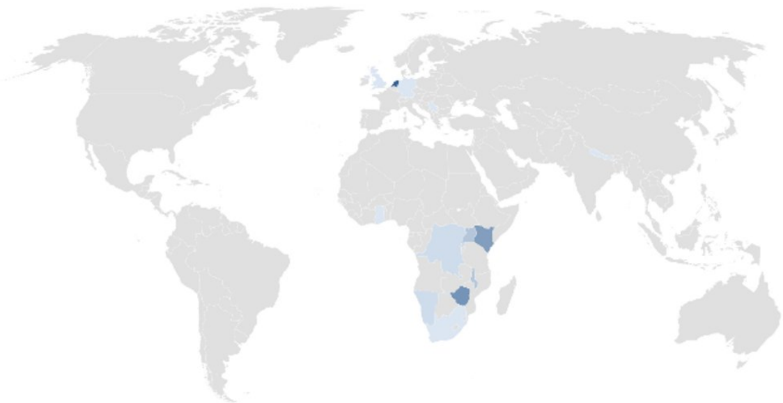
Toegezegde snelverzoeken per land